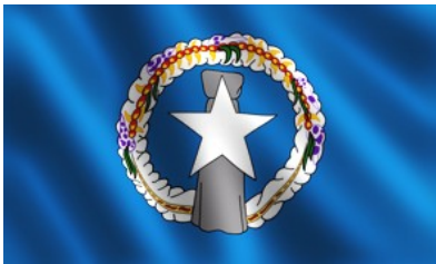
Flagge der Nördlichen Marianen

Die Marianen (besser: Nördliche Marianen) teilen ein gemeinsames Schicksal mit Guam, sie sind USA -Außengebiet im West-Pazifik/Ozeanien.